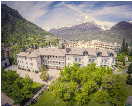
Bildungshaus St. Jodern, Visp

Die WCCM-Schweiz besteht seit ca. 20 Jahren.